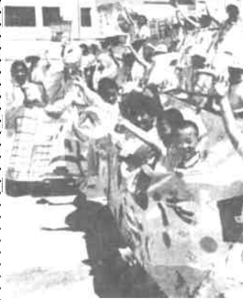
日前, 市实验小学“星期六”艺术学校的70余名小画家, 用近4个小时完成了主题为“童心迎回归”百米画卷的创作, 表达了孩子们喜迎香港回归的心情。

马克思主义之所以是科学, 就在于它始终严格地以事实作为自己的根据。而实际生活总是在不停息的变动中, 这种变动的剧烈和深刻程度, 在近一百多年来达到了前人难以想像的程度。因此, 马克思主义必定随着实际生活发展而不断发展, 不可能一成不变。这里有个学风问题: 究竟是单纯从马克思主义书本里的片言只语找答案还是真正坚持马克思主义的立场观点方法来研究当代中国和世界实际的问题。马克思列宁主义、毛泽东思想一定不能丢, 丢了就丧失根本, 就会走到邪路上去。同时一定要以当代中国改革开放和现代化建设的实际问题为中心, 以我们正在做的事情为中心, 着眼于马克思主义理论的运用, 着眼于提高对实际问题的理论思考, 着眼于新的实践和新的发展。离开本国实际和时代发展来谈马克思主义, 没有意义。孤立静止地研究马克思主义, 把马克思主义同它在现实生活中的生动发展割裂开来、对立起来, 没有出路。马克思列宁主义、毛泽东思想、邓小平建设有中国特色社会主义理论, 是统一的科学体系。在当代中国, 坚持邓小平建设有中国特色社会主义理论, 就是真正坚持马克思列宁主义、毛泽东思想; 高举邓小平建设有中国特色社会主义理论的旗帜, 就是真正高举马克思列宁主义、毛泽东思想的旗帜。